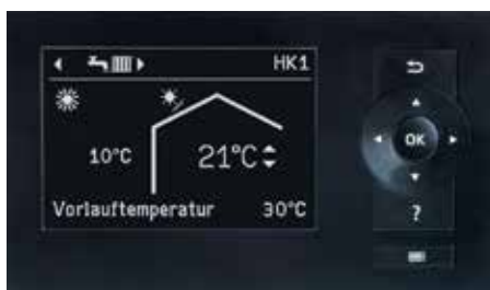
Lämpöpumpun ohjauskeskuksen Vitotronic 200 näyttö