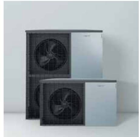
Ulkoyksiköt Viessmann-muotoilua – Made in Germany

Vitocal 222-S lämpöpumpun suuri 210 litran käyttövesivaraaja integroidulla lämmönvaihtimella takaa lämpimän veden riittävyyden.